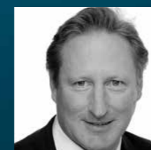
Till Tschierschky Controlling & Finance Horváth & Partner AG