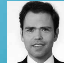
Tim Müller Industrial Goods & High Tech Horváth & Partner GmbH